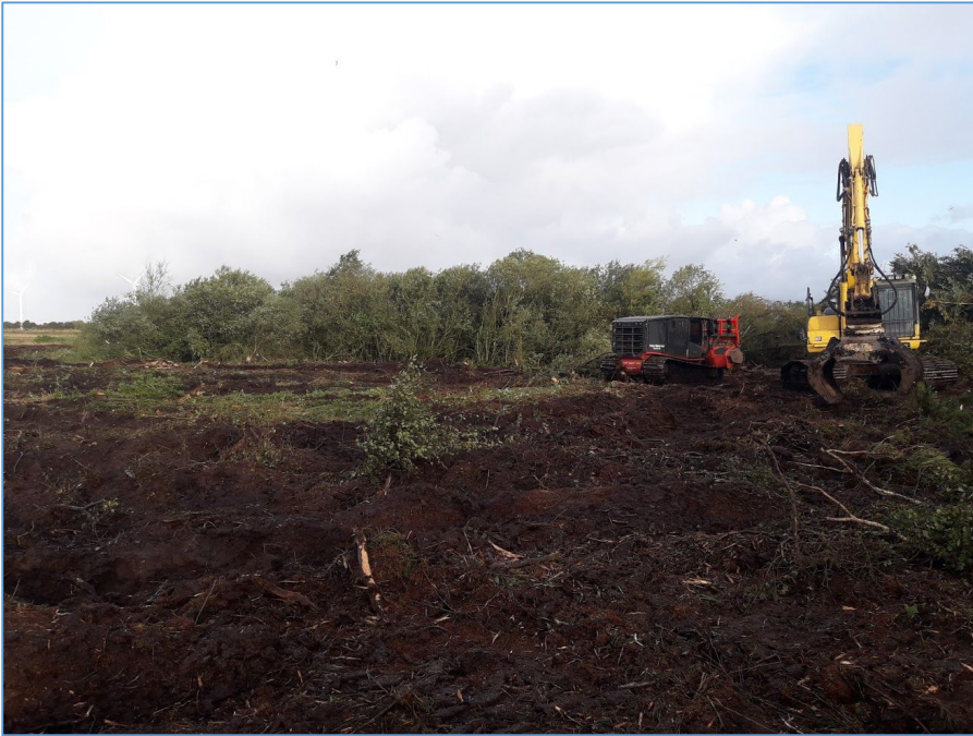
Fældning af træer og buske.