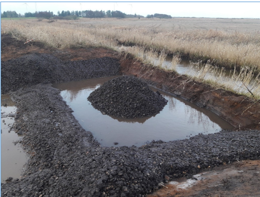
Etablering af overløbskant ved udløbet til Heager Å i den vestlige del af vådområdet.