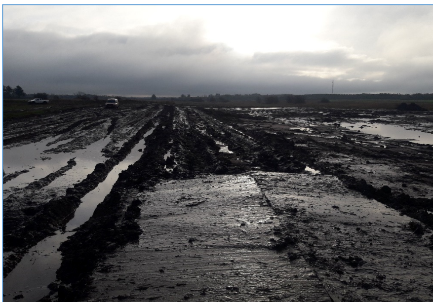
En våd og fedtet fornøjelse efter det mest regnfulde efterår i 27 år.