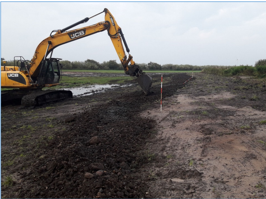
Sikring af diget langs Heager Å.