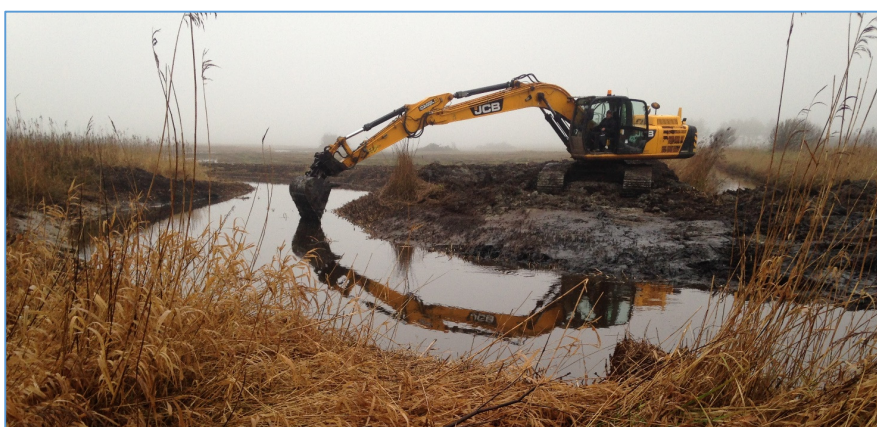
Der lukkes vand på den 20. december 2017 ved Følling Bæk delen.