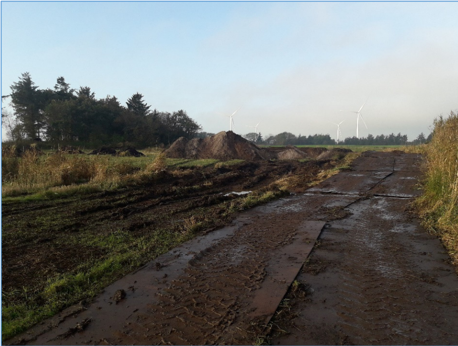
Terrænhævning af areal i det nordvestlige hjørne af projektområdet.