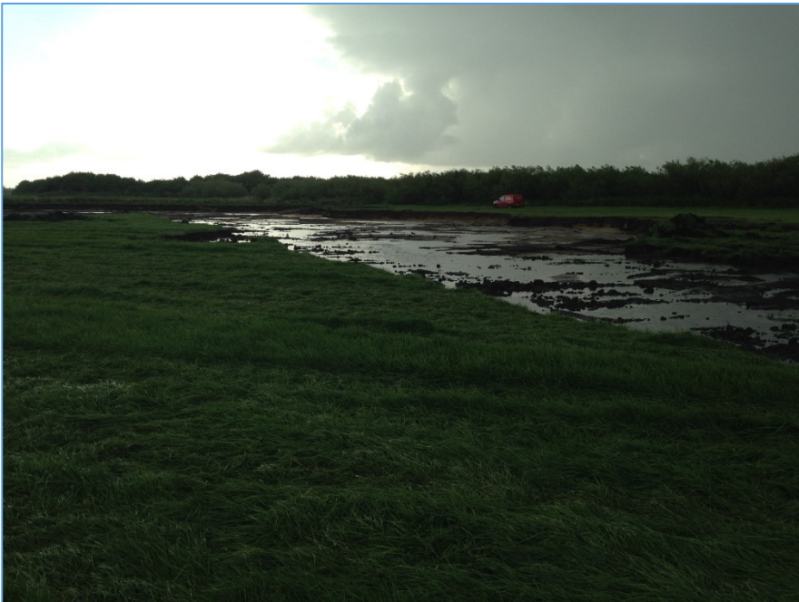
Terrænregulering i den østlige del af projektområdet.

Nedenfor er vist et par billeder af anlægsarbejdet som stod på henover efteråret og vinteren 2017.