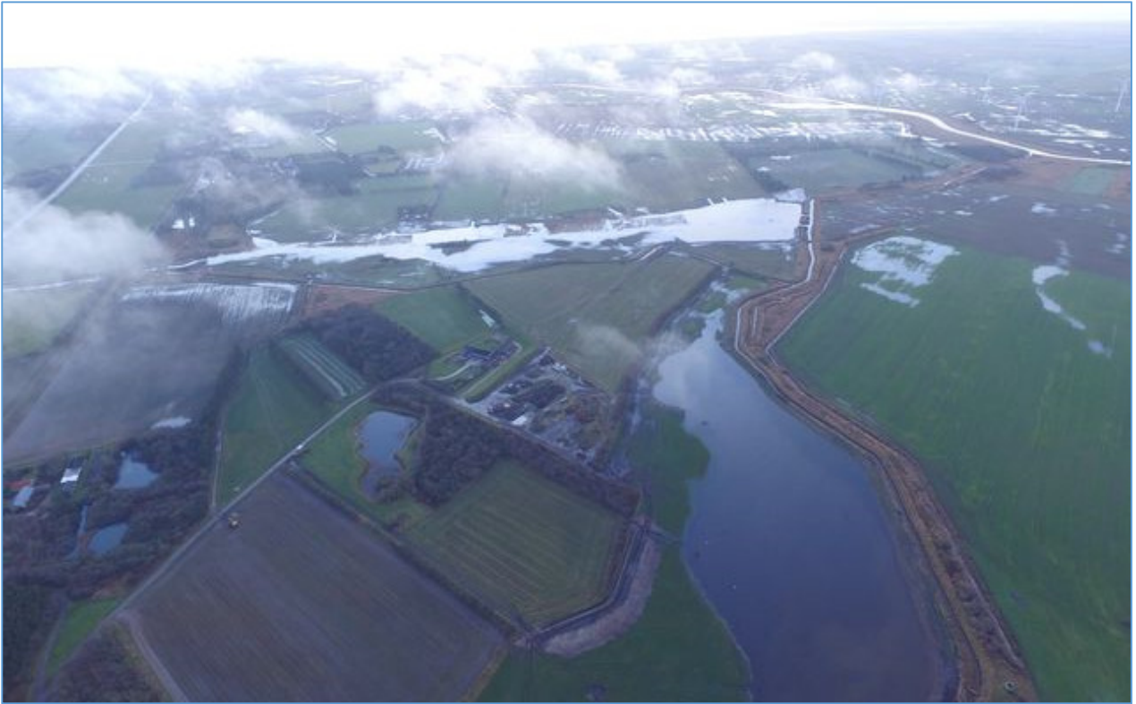
Dronebillede fra øst mod vest